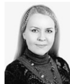
Ю.М. Степанов 1 , О.Ю. Філіппова 2

1 ДУ «Інститут гастроентерології НАМН України», Дніпро