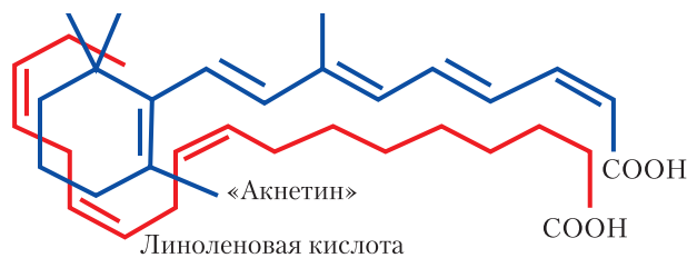
Рис. 3. Пространственное сходство молекул системного изотретиноина и линоленовой кислоты

нисты, и биологический эффект извращается или не проявляется, а при отсутствии естественного агониста ретиноиды стимулируют RAR S и RXR S со 100% биологическим эффектом [20]. Представляется вероятным, что полным агонистом RAR S и RXR S является ЛК. В первые недели терапии как системными, так и наружными ретиноидами неизбежно обострение процесса в виде увеличения количества высыпаний, появления эритемы, сухости, шелушения и чувства жжения [7, 14, 21–26]. Возникновение этих реакций объясняется тем, что в присутствии даже небольшого количества ЛК проникшие в кожу в виде лекарств ретиноиды ведут себя как антагонисты и блокируют RAR S и RXR S . В ответ на блокаду рецепторов и отсутствие биологического эффекта клетка начинает экспрессировать дополнительное количество ядерных RAR S и RXR S . Через несколько дней при продолжении лечения ретиноидами их концентрация в коже, видимо, становится несоизмеримо большей по сравнению с концентрацией ЛК, а значительно возросшее количество RAR S и RXR S позволяет