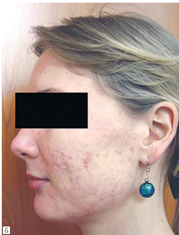
Рис. 4. Больная Л., 24 года, 4-я степень тяжести акне

а — до лечения; б — спустя 6 нед терапии раствором «Зеркалин» и 5 мес препаратом «Акнетин».